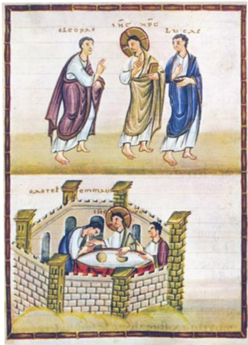
Gang nach Emmaus, Egbert-Kodex, um 980. Reichenauer Schule